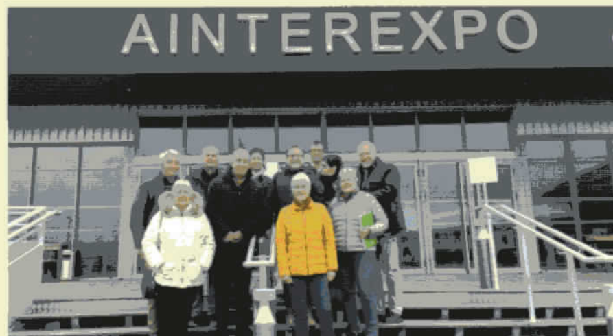
Une partie du Bureau Fédéral et du comité d'organisation

Le Parcours pour la Vie permet de montrer la mobilisation des bénévoles pour sensibiliser la population au don de sang sur plusieurs milliers de kilomètres. Le départ sera donné le 17 avril d'Albi, lieu du précédent congrès national. Avant de rejoindre la région Rhône-Alpes, le 23 avril à St Paul les Trois Châteaux (26), plusieurs étapes sont prévues en Occitanie, dont Millau (12) le 17 avril et St Hyppolyte du Fort (30). Les ambassadeurs de l'événement traverseront ensuite la Drôme, l'Ardèche, la Loire, le Rhône, l'Isère, la Savoie, la Haute-Savoie et enfin l'Ain. Ils arriveront à Bourg-en-Bresse, où ils seront accueillis par les congressistes, le mercredi 8 mai à 17h00.